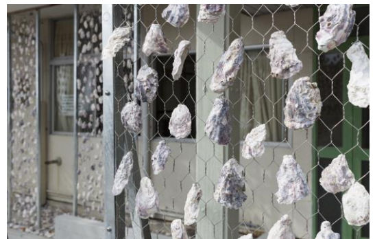
旧沖保育園牡蠣殻スクリーン