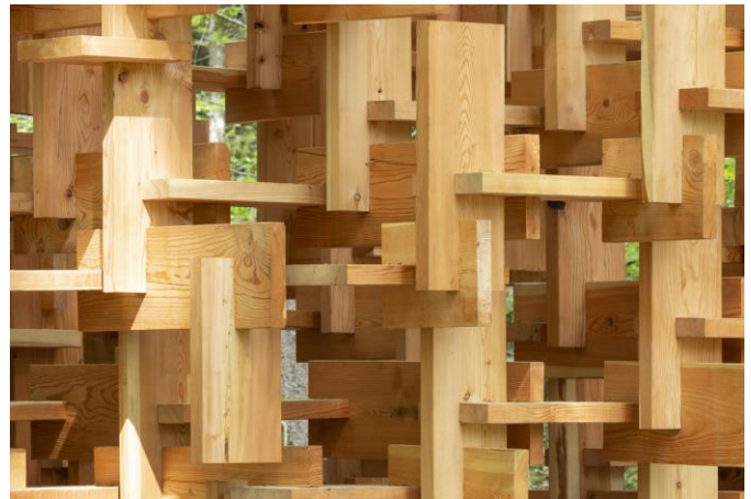
「木霊」パビリオン木組