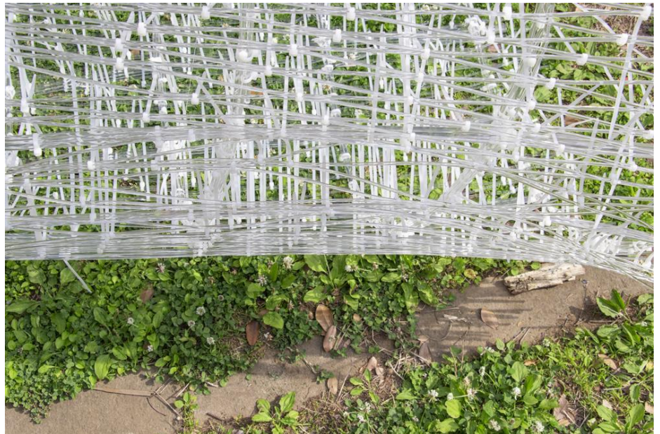
オーストラリア、キャンベラ・パビリオン(仮)モックアップ

KUMA LABの「Weaving（編む）」という言葉には「モノを編む」、「ヒトを編む」、「フィールドを編む」という意味も含まれます。「建築とは編んで作るものである」と考察する「KUMA LAB」最先端の取り組みをご紹介します。