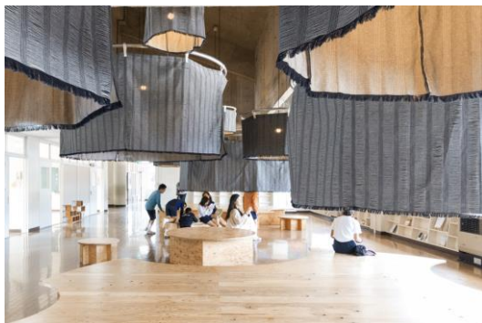
旧和木小学校和紙デニムカーテン