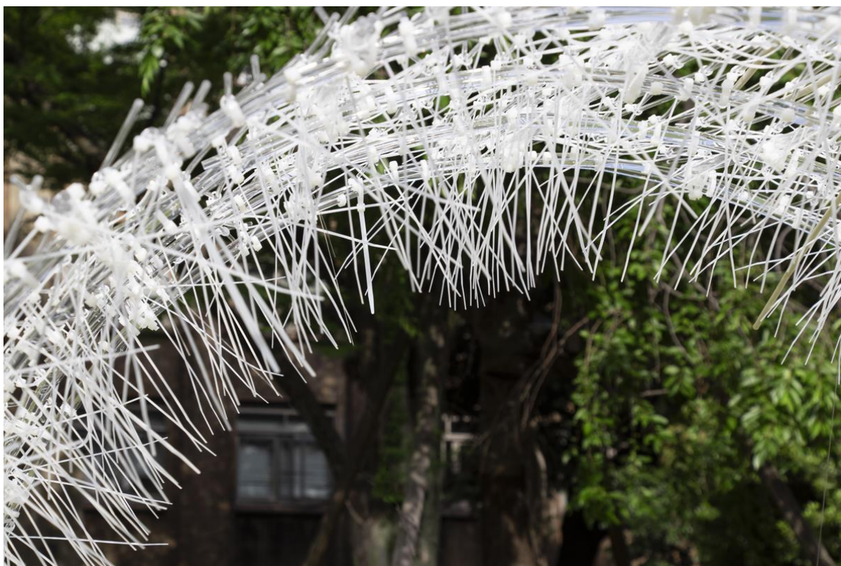
オーストラリア、キャンベラ・パビリオン(仮)モックアップ