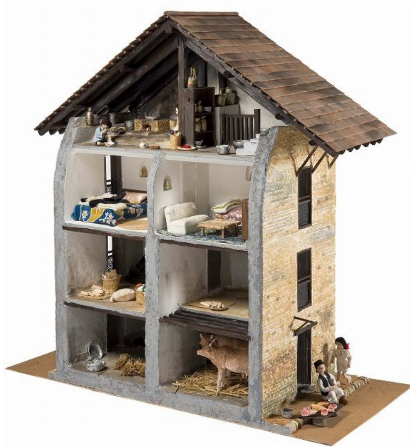
写真 1:ネパールの伝統的な台所(1/10 模型) W1125xD525xH1030

ネパールのカトマンズ地方に暮らすネパール人の伝統的な住まいの台所は、家の最上階にある。